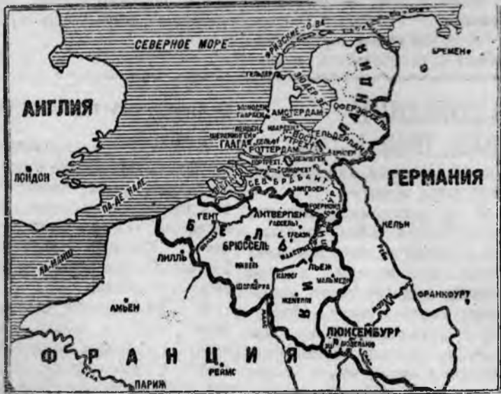
К военным операциям в Голландии и Бельгии.